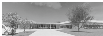
Ansichtsplanung Ersatzneubau der NEULAND-Werkstatt, Wilhelmsdorf

Die Neubauprojekte in Kluftern haben ein Investitionsvolumen von insgesamt 6 Millionen Euro. Rund 2,4 Millionen Euro werden durch das Land eingebracht. Die Inbetriebnahme ist für 2026 geplant.