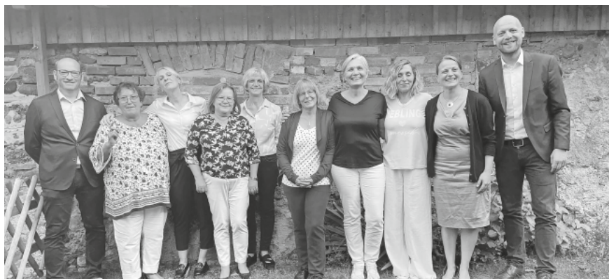
Gruppenbild von links nach rechts