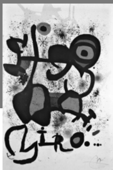
Joan Miró, Ausstellungsplakat Zürich, 1972.