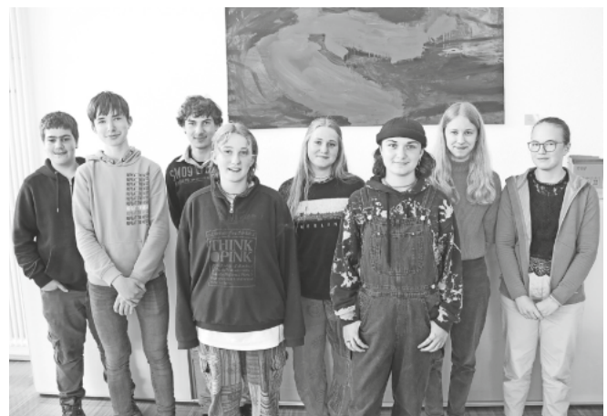
Neun Teilnehmer kamen zum Wilhelmsdorfer Jugendforum. Sie tauschten Ideen aus und brachten Gedanken ein, wie Wilhelmsdorf für junge Menschen attraktiver werden kann.