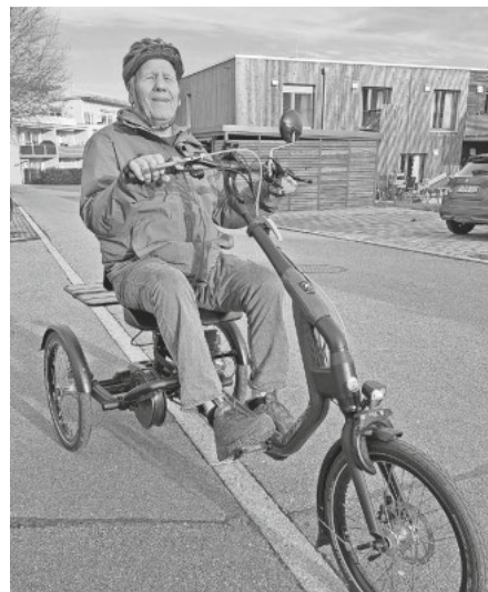
Das neue Gefährt bereitet nicht nur viel Spaß, sondern erhöht auch die Mobilität.

„Am lustigsten finden die Fahrerinnen und Fahrer den Rückwärtsgang bei diesem Fahrzeug, das das Aus- und Einparken erleichtert“, schmunzelt Dißelhorst und ergänzt: „Für die großzügige finanzielle Unterstützung im Namen aller, bedanke ich mich sehr.“ Das Dreirad wurde in Höhe von rund 8.300 Euro zu 100 Prozent von „Aktion Mensch“ bezuschusst.