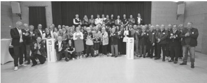
Text und Bild: Herbert Guth

Von der Förderung profitierten unter anderem folgende Wilhelmsdorfer Vereine: DRK Ortsverein Wilhelmsdorf, Verein zum Erhalt des Lengenweiler See e.V., Förderverein Miteinander Füreinander Wilhelmsdorf e.V., Kitzrettung Wilhelmsdorf e.V.