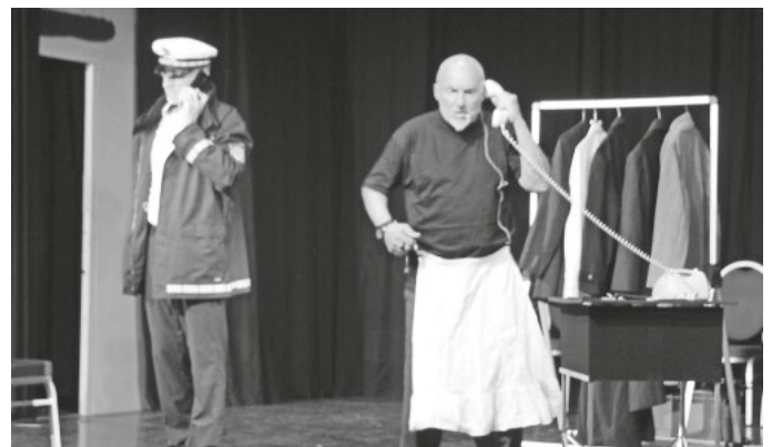
Ruft wirklich die Polizei an?

Wie raffiniert Trickbetrüger am Telefon vorgehen, zeigte das interaktive Theaterstück „Hallo Oma, ich brauch Geld!“. Gemeinsam mit den Landfrauen Wilhelmsdorf und dem Kulturverein Wilhelmsdorf hatte der Förderverein Miteinander Füreinander Wilhelmsdorf e.V. dieses Theaterstück in der Scheune am 24. April 2026 organisiert. Das Szenario wirkte erschreckend real: Das Telefon schrillt und eine weinerliche Stimme fleht um Hilfe: „Ich hatte einen schrecklichen Unfall, ich brauche sofort Geld für die Kauti- on!“ Was wie aus einem schlechten Film klingt, ist für viele Senioren bittere Realität.