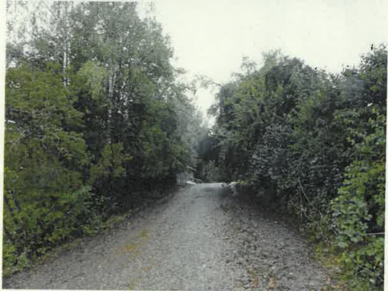
Bild 9: hochwertige Heckenstruktur als Abgrenzung des Gebäudebestands im Norden zur Ackerfläche hin.