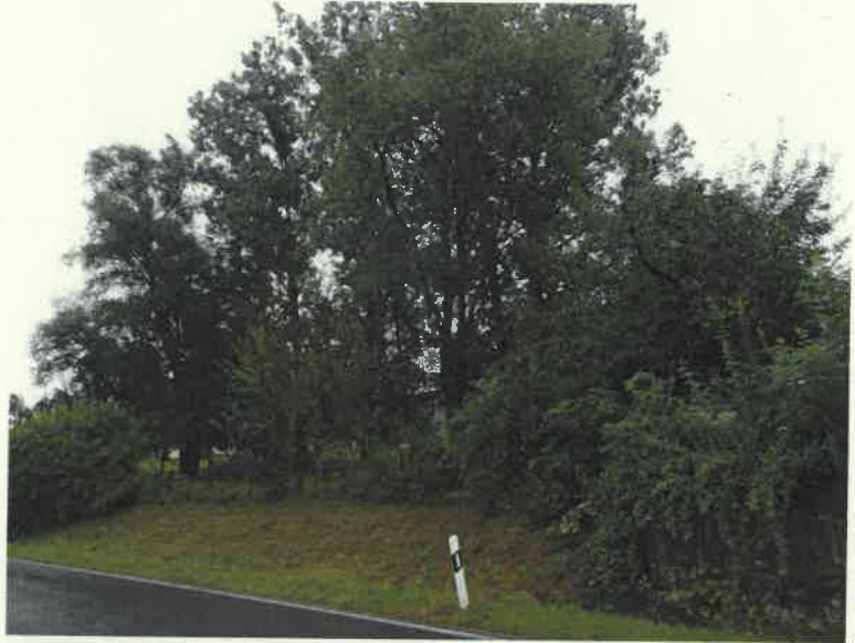
Bild 4 – 6: Reichhaltiger alter Baum- und Gehölzbestand und hochwertige Streuobstwiese mit vielen Altbäumen im geplanten Wohngebiet südlich der K 7972 und östlich der Rotach (nördlich der landwirtschaftlichen Funktionsgebäude).