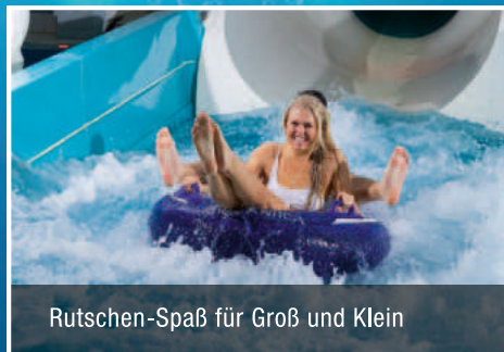
Rutschen-Spaß für Groß und Klein