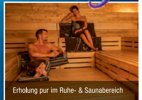
Erholung pur im Ruhe- & Saunabereich