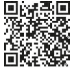
QR Code scannen und teilnehmen

Folgen Sie der Bundesagentur für Arbeit auf Twitter.