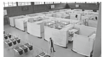
So präsentiert sich die Rotach-Halle vor Einzug der ukrainischen Schutzsuchenden.