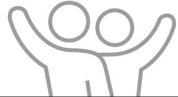
Sandra Flucht Bürgermeisterin