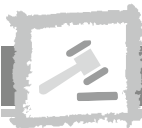
Sandra Flucht Bürgermeisterin